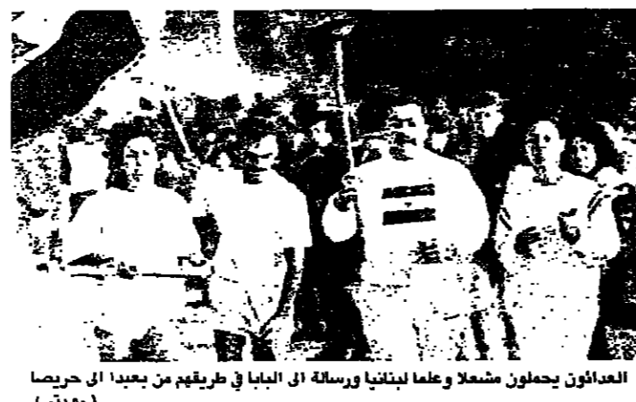
العاملون يحملون شمعا وعلما لبنانيا ورسالة الى البيا في طريقهم من عبدا الى حريسا

سلسلة بشرية من عبدا الى السفارة البايوية في يوم القضان مع الرهائن والمحتجزين عون: نرفض الديبلوماسية المرتكزة على الكاذب وبيع الشعوب بوانتي: لا وحدة بلا حوار وفي ظل خوف القلقين على المستقبل بشارتي في بيروت اليوم للتوسط بين امل وحزب الله وقدائف قتل اثنين في سن الفيل